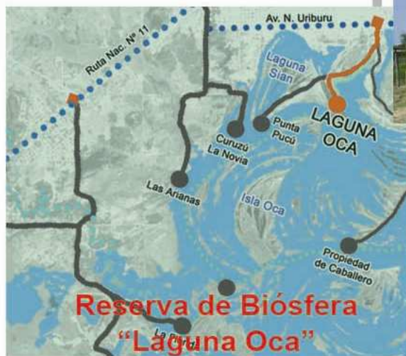
Reserva de Biósfera "Laguna Oca"