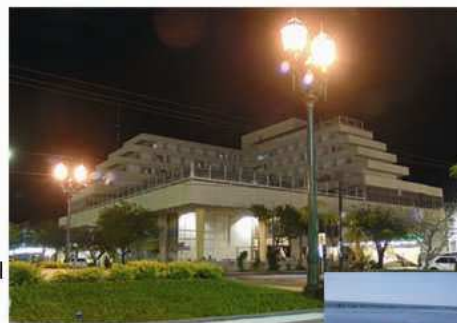
Hotel Internacional de Turismo