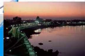
Ministerio de Turismo