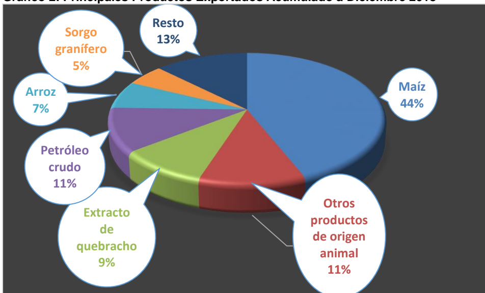
Gráfico 2: Principales Productos Exportados Acumulado a Diciembre 2018

Como se puede observar del mix de Exportaciones Formoseñas en el 2018 se concentra en estos 6 ítems que representan el 87.41% de las exportaciones de origen provincial. Siendo los de mayor participación el maíz con 44%, petróleo crudo con 11% y otros productos de origen animal con 11% respectivamente; seguidos por extracto de quebracho (9%), arroz (7%) y sorgo granífero (5%).