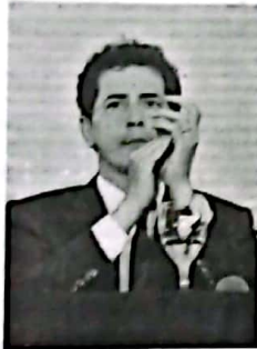
EDUARDO DE PEDRO.

BUENOS AIRES - El ministro del Interior, Eduardo “Wado” de Pedro, admitió ayer que trabaja en un proyecto que apunta a eliminar las elecciones intermedias nacionales, al argumentar que “cada Gobierno o fuerza que ofrece una propuesta de gestión debe tener los cuatro años para desarrollarla”. Tras estas declaraciones, referentes de Juntos por el Cambio salieron a cruzarlo públicamente y lo acusaron de estar “fuera de la realidad” y de “vender humo”.